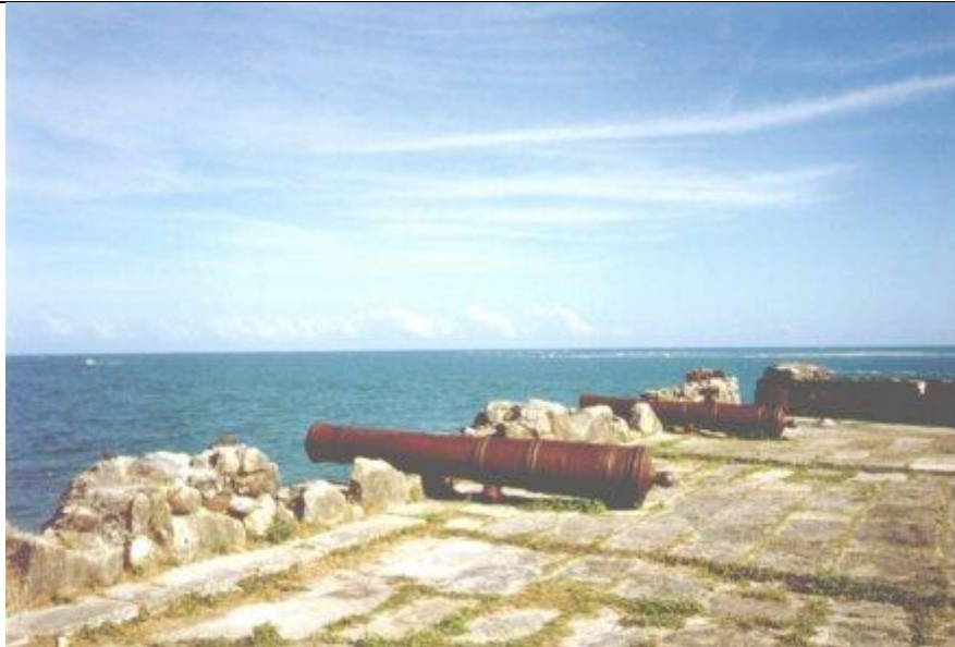
A Guerra se baseou muito nos fortes. Vista atual do Forte Orange, na Ilha de Itamaracá

A visão deste "Brasil melhor" que é tanto difundida, é influenciada pelo fato do governador da colônia holandesa ter sido o Conde Maurício de Nassau, cuja popularidade era ampla entre todas as culturas.