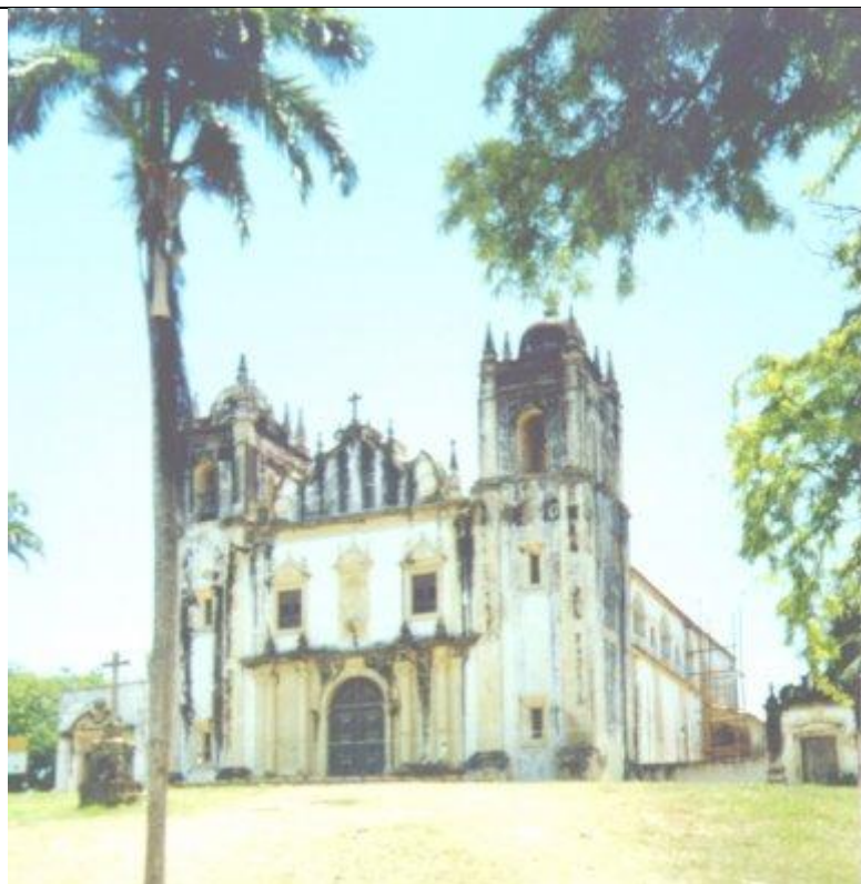
Vista de uma das principais igrejas de Olinda, com arquitetura tradicional portuguesa colonial

Primeiramente tentou-se conquistar a cidade de Salvador, capital administrativa da colônia portuguesa, porém com a derrota optou-se por Olinda e Recife, centros econômicos. Em 1630 uma frota composta de 56 navios, com 3780 tripulantes e 3500 soldados chega a Olinda. Rapidamente dominaram esta vila e pouco tempo depois a de Recife.