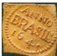
Moeda do Brasil Holandês, de 1645

Em contrapartida, a política holandesa restringia muito mais as possibilidades econômicas do Nordeste do que a portuguesa, bem como limitava o plano social, com a crise entre brancos e judeus, negros e índios. Assim, durante os 24 anos de dominação foi criada uma grande segregação religiosa-racial.